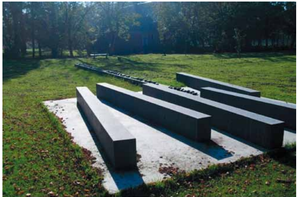
Kunst om te gedenken

Ik droomde dat ik bij een brand stond Feller dan de heetste zon De groene brandweerwagen reed hard weg Ik droomde dat ik bij een brand stond Vonken knetterden omhoog in het donker Ik zocht mijn broertje en de hond Ik droomde dat ik bij een brand stond Feller dan de heetste zon