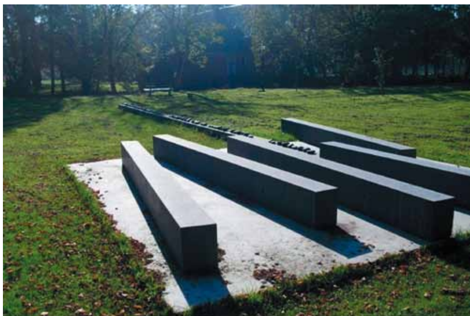
Kunst om te gedenken

Ik droomde dat ik bij een brand stond Feller dan de heetste zon De groene brandweerwagen reed hard weg Ik droomde dat ik bij een brand stond Vonken knetterden omhoog in het donker Ik zocht mijn broertje en de hond Ik droomde dat ik bij een brand stond Feller dan de heetste zon